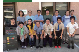
NPO 法人たま・あさお精神保健福祉をすすめる会 はっぴわーく (多摩区 登戸)